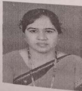
డా.ఎం.ఫామిద బేగం హిందీ అధ్యయనశాఖ